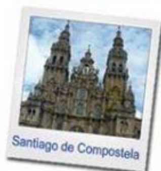
Santiago de Compostela